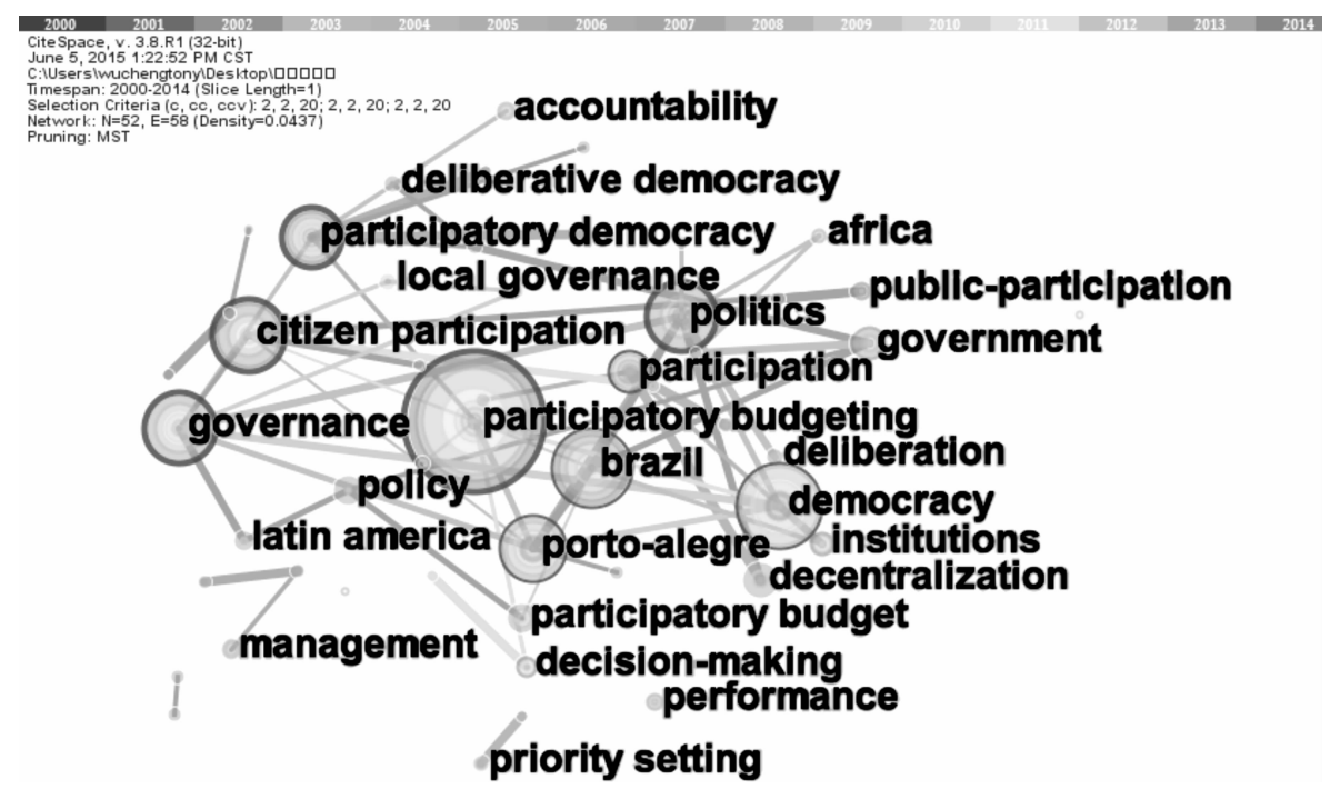
图 3 参与式预算研究领域关键词图谱 (节点越大，频数越多)

式预算的研究可以总结为 8 个主要因子，但是由于因子之间具有相互的交叉性，笔者根据因子分析结果，将目前国际参与预算的研究总结为参与式预算的主体 (Brazil、Porto Alegre、Latin America)、构成客体 (citizen participation、budgeting、local government、Civil society)、方式 (participatory budgeting、participatory democracy)、条件 (participatory budgeting、participatory democracy) 以及目标 (participatory、Democracy、Decentralization) 这 5 个方面的研究。然而根据文献调研以及可视化分析的结果，这 5 个方面的研究是有一定的逻辑演进关系的。从文献上来看，2000 - 2009 年参与式预算更多的是在关注参与式预算主体数量的扩大，从巴西扩展到秘鲁 [5] 、阿根廷 [5] 、欧洲 [6] 、印度 [7] 、中国 [8] 等地区；其次，仍有一部分学者关注参与式预算的组织数量的问题 [9] 参与式预算的人口数量问题 [5][9] 。然而，这一趋势却在 2010 - 2014 年发展较大的变化，如图 3 所示。笔者将高频关键词导入 CitespaceⅢ做纵向的可视化分析，确定的阈值为 ( 2 , 2 , 20 ) , ( 2 , 2 , 20 ) , ( 2 , 2 , 20 ) , 运行 CitespaceⅢ软件。图 3 的可视化结果显示，关键词 participatory budgeting 在参与式预算中处于核心领域，中心性为 0.28。图中的细线越多，表明词与词之间的关系越紧密。词与词之间不同颜色的连接线，表示共现次的变化随着时间的变化而变化。2010 - 2014 年，参与式预算在近 4 年的研究中，逐步从参与式预算参与主体数量问题的研究迈向协商民主、责任、绩效、简政放权、政策制定、公共参与等质量问题的探索。随着全球经济的发展，以及参与式预算实践发展的深入和理论研究的普及，参与式预算的研究不仅只局限于其对参与式预算人数的关注，更多的学者倡导对参与式预算的质量的考察，对参与式预算的参与人群、参与式预算的选择问题、参与式预算的合法性、参与式预算的合适性等问题，开始着重考虑参与式预算中民众的权力与权利、政府责任、非营利组织的角色问题。其次，随着政治科学中祛除价值中立口号的兴起，越来越多的学者开始从不同利益群体的角度出发，改变了最初地方政府主导参与式预算的局面，参与式预算的研究越来越科学化、专业化。因此，参与式预算的效果和质量研究将会成为主流。